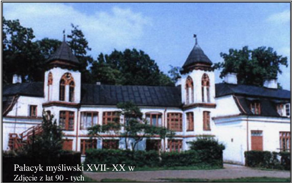
Pałacyk myśliwski XVII- XX w Zdjęcie z lat 90 - tych