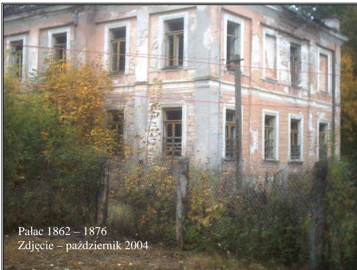
Pałac 1862 – 1876 Zdjęcie – październik 2004