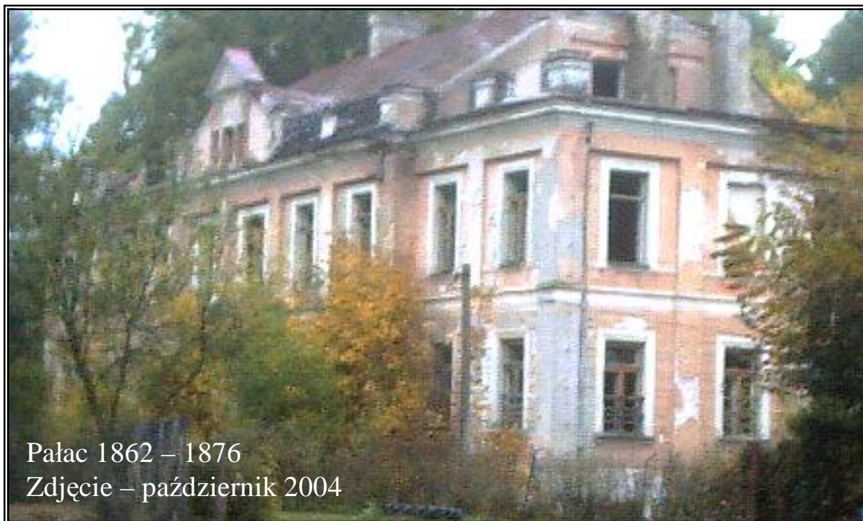
Pałac 1862 – 1876 Zdjęcie – październik 2004