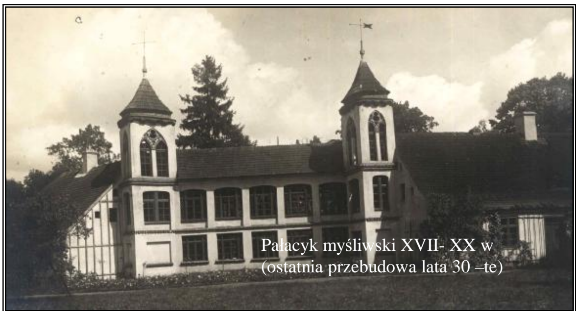
Pałacyk myśliwski XVII- XX w (ostatnia przebudowa lata 30 -te)